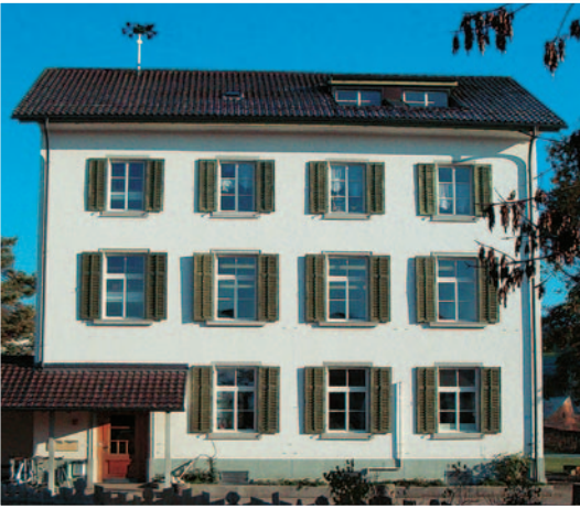
Schulhaus «Schuepis» in Dürnten

Grosse Unzufriedenheit in den Quartieren Breitenmatt und Guldistud herrscht mit dem öffentlichen Verkehr . Der Gemeinderat meint, dass mit der Einführung eines Nachtbusses und des Buxi der erste Schritt getan ist. Die Erschliessung dieser Gebiete würde grössere bauliche Massnahmen voraussetzen, da die dortigen Quartierstrassen und Kreuzungen nicht für grosse Fahrzeuge geeignet sind.