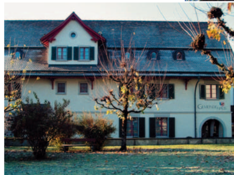
Das Gemeindehaus in Dürnten

Unsere in der letzten C-Post geäusserten Befürchtungen haben sich leider bewahrheitet – ja wurden sogar massiv übertroffen.